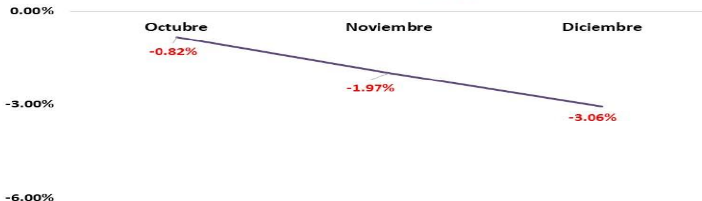
Comportamiento RFP Oct- Dic 21 -1.98%