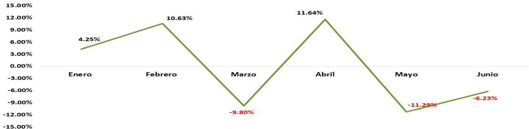
Comportamiento RFP Ene - Jun 21 0.54%